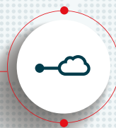
Microsoft Azure Peering Service (MAPS)